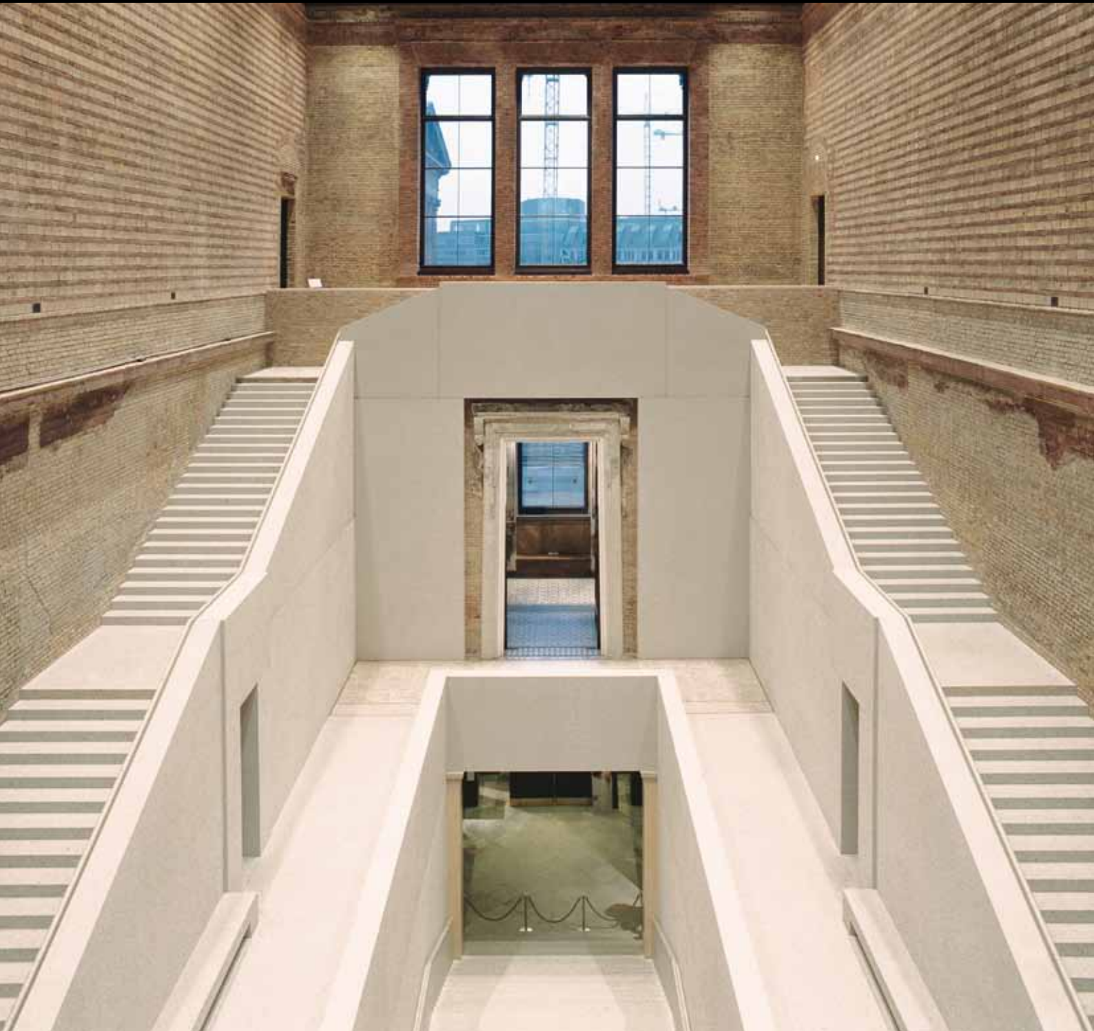
Neues Museum, Berlin Architekturbeton mit Dyckerhoff WEISS